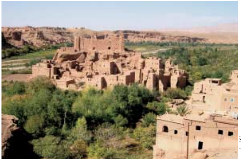
Normalean, basamortuan ez dago urte osoan ur-emia duen ibairik, baina, ibai-arroak inguru heze samarrak dira.

Cameluak Egipton sartu zituzten lehenengo, eta, gero, Sahara osora zabaldu ziren.