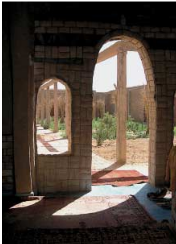
Zibilizazio handiak izan dira Sahararen inguruan, gizon-emakumeak inguru latz horretara egokitu diren seinale.

Basamortuko egitura ezagunenak dira erg eta reg deiturikoak. Haizearen