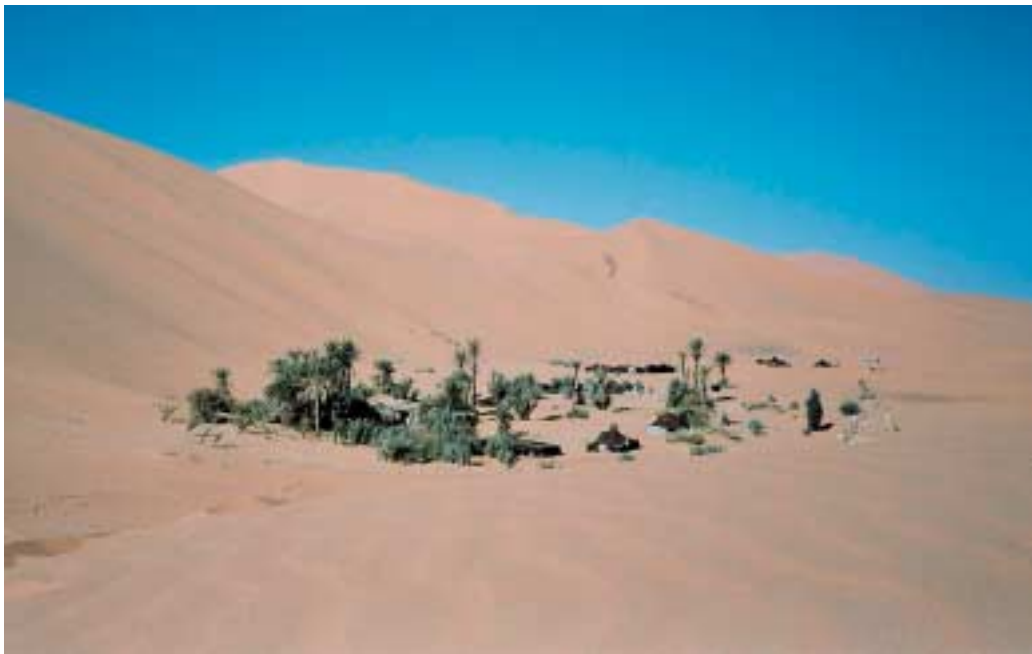
Oasiak itzala, jana eta ura ditu; paradisia da basamortu elkorrean.