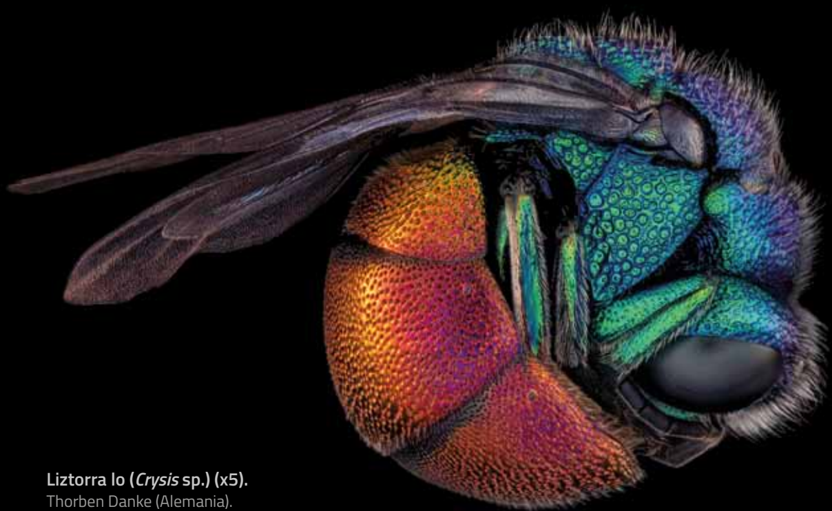
Liztorra lo ( Crysis sp.) (x5). Thorben Danke (Alemania).