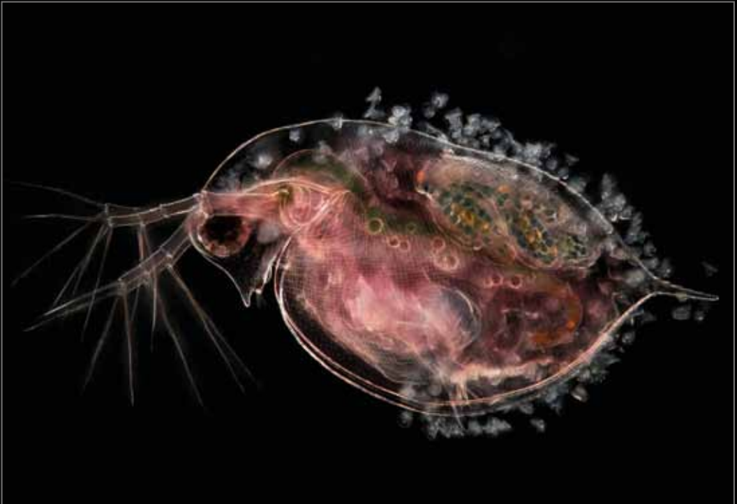
Ur-arkakuso bat ( Daphnia ), bere enbrioak eta parasito peritrikoak garraiatzen ari dena (x10). Jan van IJken (Herbehereak).