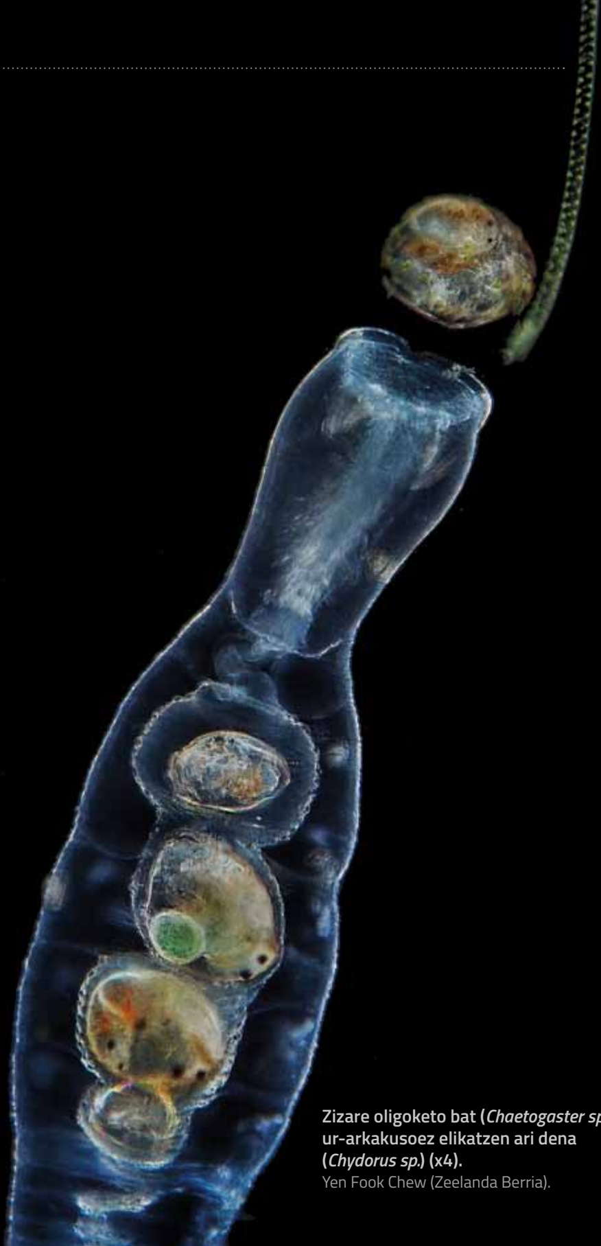
Zizare oligoketo bat ( Chaetogaster sp. ), ur-arkakusoez elikatzen ari dena ( Chydorus sp. ) (x4). Yen Fook Chew (Zeelanda Berria).