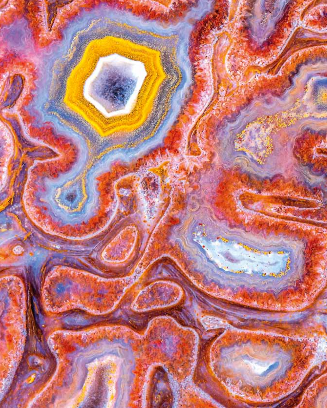
Dinosaurio-hezur agatizatua (x5). Norm Barker (Baltimore, AEB).