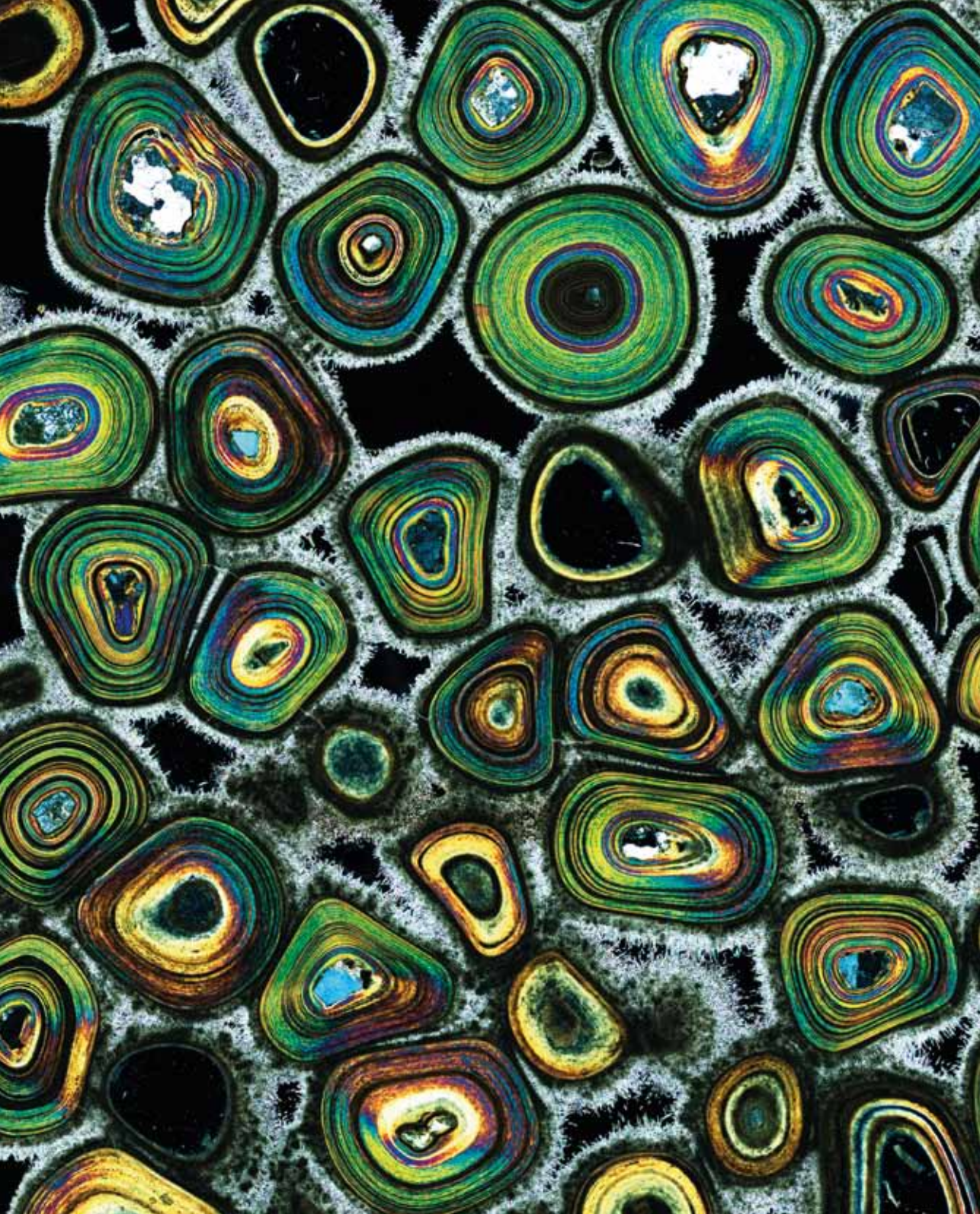
Karlsbad Sprudelstein izeneko arroka sedimentarioa, aragonitozko zirkulu konzentrikoak tipula baten gisan haztean sortzen dena (x20). Bernardo Cesare eta Markus Neumann (Italia).