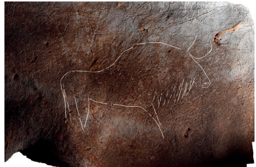
Alkerdi 2ko grabatuetako bat. ARG.: O. Rivero eta D. Garate.

Alkerdi 2 haitzuloan (Urdazubi), duela 25.000 urteko dozena bat grabatu figuratibo aurkitu dituzte. Haien artean, bisonteak, uroak, zaldiak eta, bereziki, lau bulba nabarmentzen dira. Horrez gain, margo gorriz egindako bost lerro bikoitzen serieak daude. Iristeko zaila den leku batean zeuden ezkutatuta.