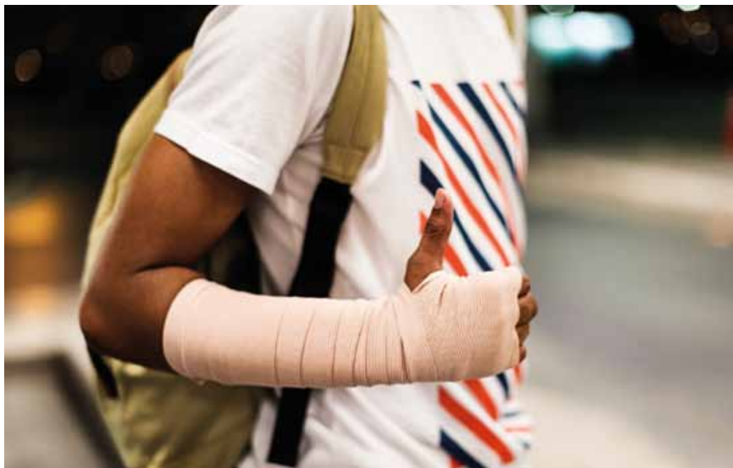
Garai horretan, gazteak ez dira kezkatzen etorkizunaz; horren ondorioz, jokabide arriskutsuak har ditzakete.

Azaldu duenez, oinarrian lotuta dago eskakizun energetikoarekin: hain handiak dira, aurrena atal ebolutiboki zaharrenak garatzen direla, eta, ondoren, berriagoak. Gainera, Pérez Iglesiaren iritziz, zentzuzkoa da lehenago garatzea trebetasun fisiokoak, eta gero gaitasun sozialak.