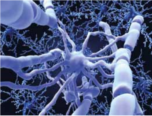
Nerabezaroan, kortex osoan, baina bereziki kortex prefrontalean, mielina lodituz doa.

Hori oso garrantzitsua da, kortex prefrontalari bai-tagokio kontrol exekutiboaren funtzioa. “Kortex prefrontalaren lana da, batez ere, aukera desberdinak ebaluatzea, eta, ebaluazio horren ondorioz, erabaki bat hartzea. Horregatik esan dezakegu, neurri handi batean, erabaki moralen gunea ere horixe dela. Eta guztiz garatu arte, ezin da ondo erabaki; nerabeek badakite zerk ematen dien plazera, baina ez dituzte aintzat hartzen etorkizunean horrek izan ditzakeen ondorioak”.