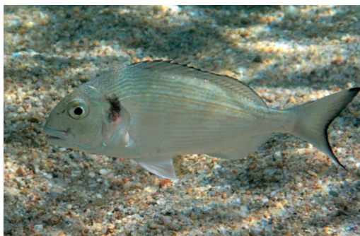
Urraburuetan ikertu dute nola metatzen diren kutsatzaileak.

Bilboko estuarioan badaude kutsatzaile horiek, eta arrainei nola eragiten dieten aztertu dute Ziarrustak eta taldekideek. Zehazki, Plentziako Itsas Estazioan esposizio-esperimentuak egin dituzte urraturuekin, ebaluatzeko amitriptilinarean, ziproflofaxinarean eta oxibentzonaren biometaketa nolakoa den eta ehunetan nola banatzen diren. "Horrez gainera, kutsatzaile horien biotransformazioa aztertu eta degradazio-produktuak karakterizatu ditugu, eta, azkenik, kutsatzaile horiek arrainetan eragin ditzaketan maila molekularreko aldaketak ikertu ditugu», azaldu du Ziarrustak.