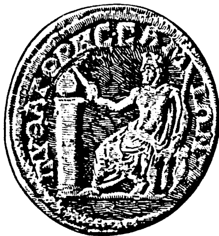
Pitagorasen irudia duen antzinako txanpona.

aspaldi ezagutu eta erabiltzen zuten. Baina, haiek problema partikularrak ebazteko erabiltzen zuten bitartean (hau da, kasu batzuetan betetzen zela besterik ez zekiten), grekoek berdintza kasu guztietarako baliagarria zela ezarri zuten. Pitagoras Fenizia eta Egipton luze ibili zen. Ez litzateke harritzekoa, beraz, teorema babiloniar eta egipciarrengandik ikasi izana. Esate baterako, egipciarrek 12 zati berdinetan banatutako soka erabiltzen zuten angelu zuzenak egiteko. Izan ere, 3, 4 eta 5 zatiko aldeak zituen triangelua zuzena baitzen.