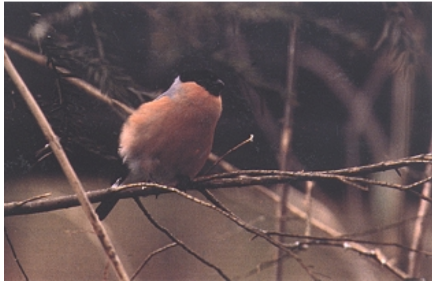
Ikusi duenak nekez ahaztuko du fringilido txapar honen itxura bitxia.

Bestalde, txitoek 16-18 egun igarotzen dituzte habian hegan egiteko gai izan aurretik, eta txori hauen lurraldea tamainaz txikia izaten denez, kumeak elikatzea araren eta emearen artean burutu beharreko lana izaten da. Hazijale