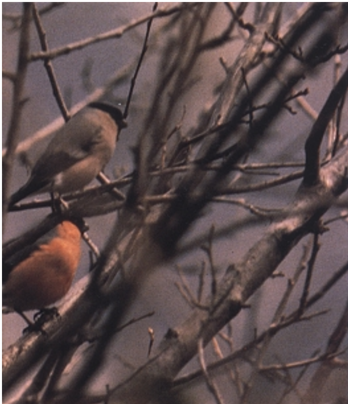
Gailuparen kasuan dimorfismo sexuala nabarmena izaten da oso, koloreari dagokionez.