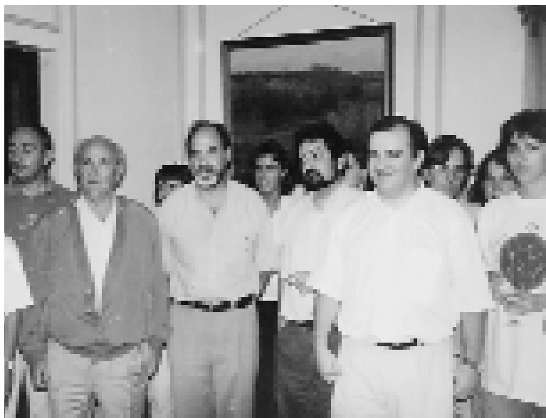
Urteroko ohitura berrituz, aurten ere Iruñeko Udaletxeak harrera ofiziala egin dio UEUri. Bi erakunderen arteko sintonia azpimarratzeko eta elkarri eskerrak emateko tenorea izan zen. Ondoren, mokadu bat janean Iruñeko bititza soziala gertuagotik ezagutzetik izan genuen.

Eguerdiko 12ak Renè Cassin Lizeoan. Bazkaltzeko ordua da Iparraldean. Aurten egoitza berria estreinatu du UEUK, erosoagoa, egokiagoa, jantokia, taberna, ikasgelak eta logelak integratu dituena. Lagunarteko giroa sortzeko ere lagungarria gertatu da. Antolatzailerik pozik daude; bazkaltzeko orduan mahai guztiak beteta ikustea ez baita urtero gertatzen. Jendeak erantzun dio UEUren deiari eta ikastaroak arrakastaz burutu dira. Larunbatean, uztailaren 6an, Mikel Laboaren kantaldiak amaiera emango die Baionako Udako