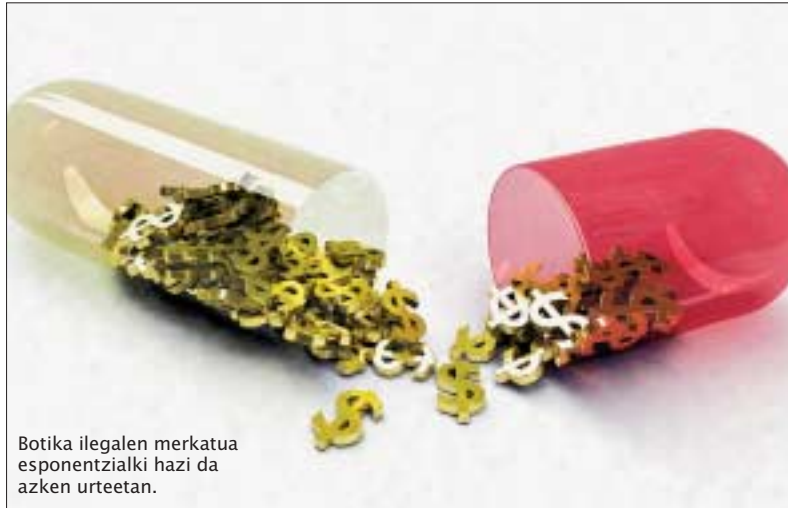
Botika ilegalen merkatua esponentzialki hazi da azken urteetan.

Gainera, informazio-zerbitzuen datuek erakusten dutenez, botika ilegalen merkatua esponentzialki hazi da azken urteetan. European, 2005ean 2004an baino bi aldiz sendagai faltsu gehiago konfiskatu zituzten (500.000 produktu), eta 2006an aurreko urtean baino bost