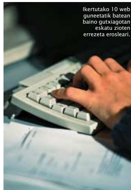
Ikertutako 10 web guneetatik batean baino gutxiagotan eskatu zioten errezeta erosleari.

Halaber, web guneen % 5 baino gutxiago azaltzen ziren farmazia ofizialen zerrendetan; % 6,2tan bakarrik ematen zuten benetako farmazialari baten izena eta harekin harremanetan jartzeko aukera; botiken prezioetan beharpenak eta eskaintza bereziak